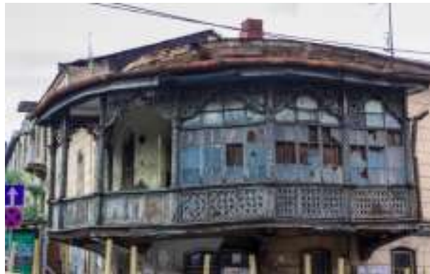
Schöne, traditionelle Häuser verfallen – auch in Tiflis.

Wer jedoch mit den Augen eines Historikers auf die vergangenen knapp 70 Jahre der Bundesrepublik Deutschland zurückblickt, stellt fest, dass spätestens seit Mitte der Sechziger-Jahre in Politik, Medien und Bildung eine Ideologie vermittelt wird, die in erschreckender Weise an die Denkmuster des längst totgeglaubten Marxismus erinnert: